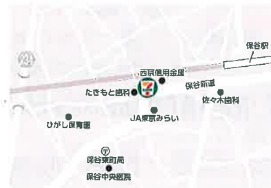
西東京東町3丁目店 西東京市東町3丁目11-2 24時間営業・年中無休